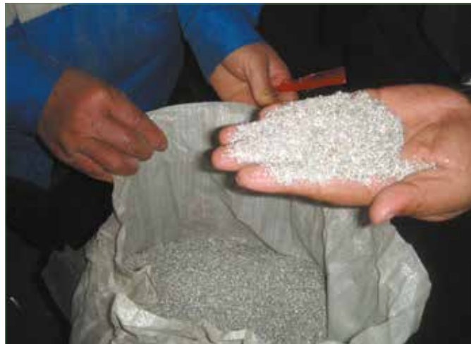
Фото 3. Алюминий после отделения от полиэтилена

Для решения проблемы с органическими остатками на стенках использованной упаковки Tetra Pak Красно-