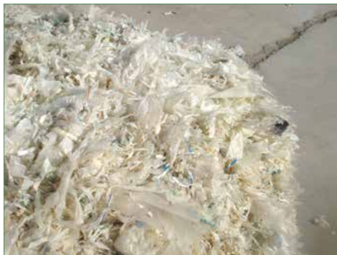
Фото 4. Полиэтилен после отделения от алюминия

Большое место в статье посвящено описанию деятельности микроорганизмов, развивающихся в остатках орга-