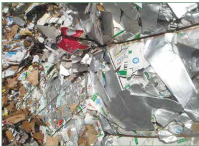
Фото 1. Tetra Pak до отделения волокна

Что же до инноваций в области переработки упаковки Tetra Pak, то среди наиболее передовых методов, исполь-