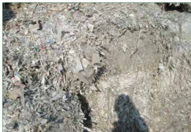
Фото 2. Полиалюминий после отделения волокна в водной среде