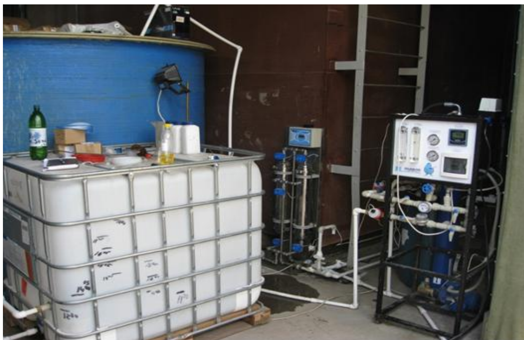
Пилотная установка современной технологии очистки гипертоксичных вод ГУП «Полигон «Красный Бор»

Методами биологического тестирования с использованием тест-объекта Daphnia magna было установлено, что очищенная по технологии Hood River Finland LTD вода обнаруживает биологические признаки, характерные для сточных вод, уже прошедших обработку в аэротенках.