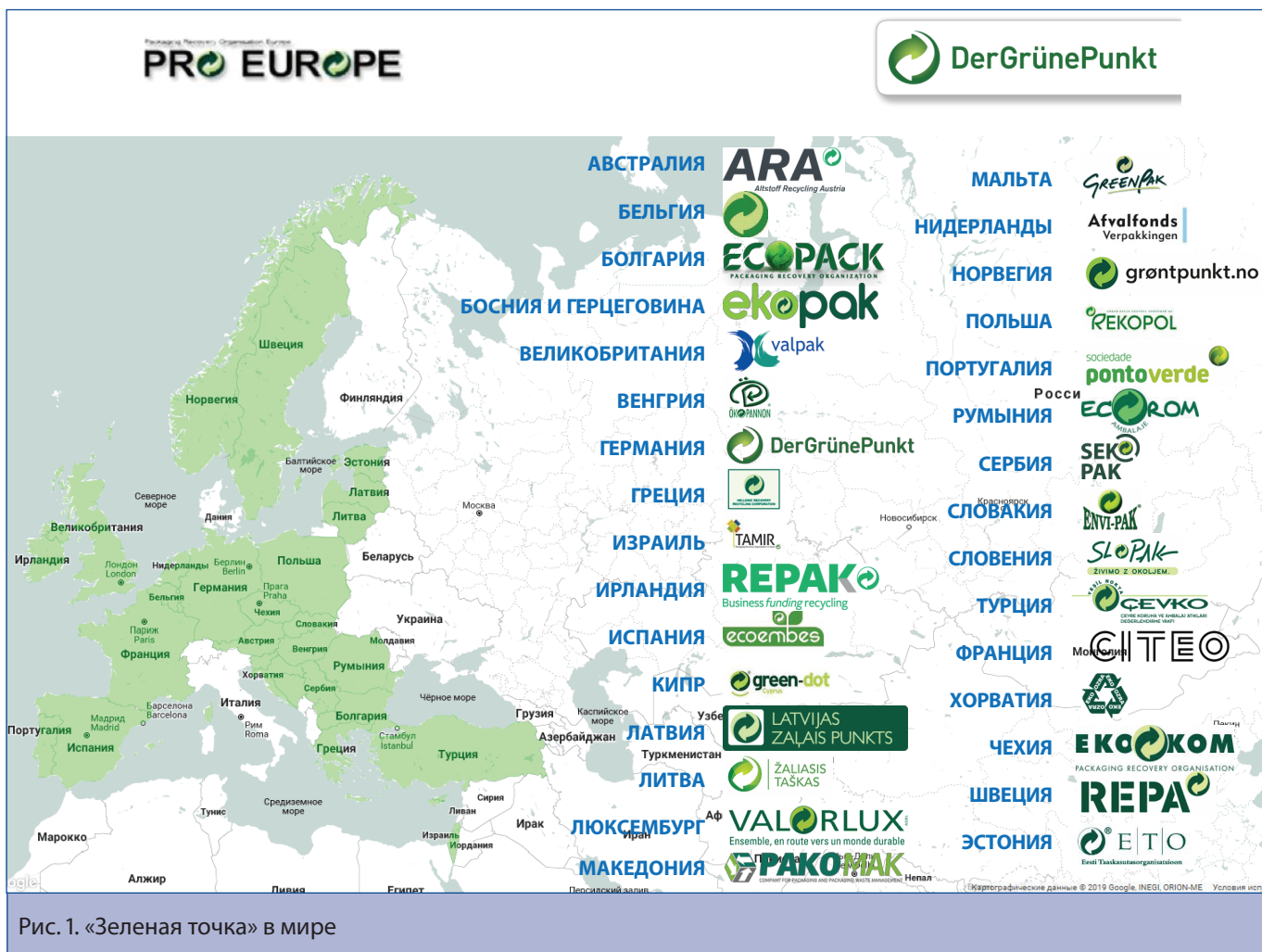
Рис. 1. «Зеленая точка» в мире

няется на все страны ЕС, а также на Швейцарию и Норвегию.