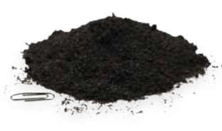
Конечный продукт 99,9% чистоты